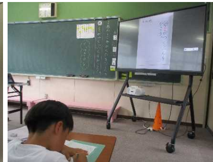
ノート指導の工夫（1年生）