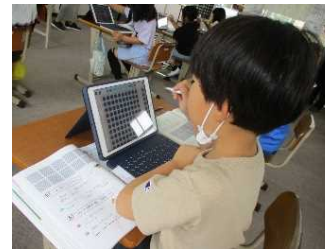
端末をつかって考えをつくる