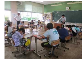
単元のまとまりを見通し、じっくり予想する場の設定