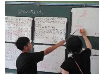
書いて説明する場の設定