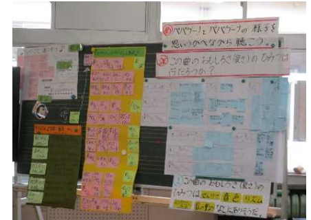
音楽科における言語活動の工夫