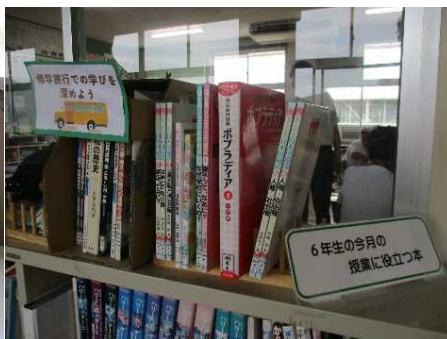
どの学年も読書環境を整えている