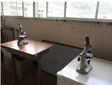
いつでも観察できるように