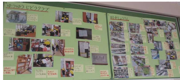
どの学年も、生活科・総合的な学習の時間の様子が分かる掲示をしている