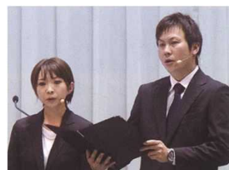
(漁業者メッセージ)