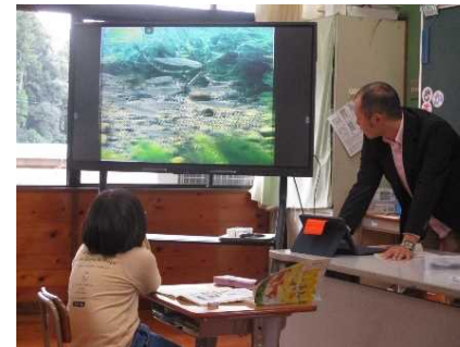
ICTや全文掲示から必要な情報を取り出す