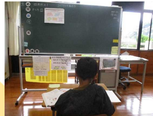
本時の課題の解決に必要な情報 (既習事項)の掲示