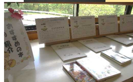
おすすめの本を紹介、読書月間の設定