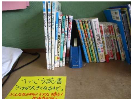
並行読書材を常備