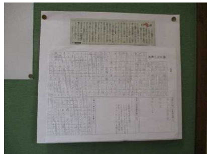
コラム学習・言語活動の充実