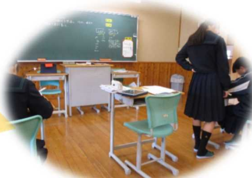
仮定法過去の文について、自分の想像したことを英文に表す学習において、自分のペースで学んだり、協働したりする