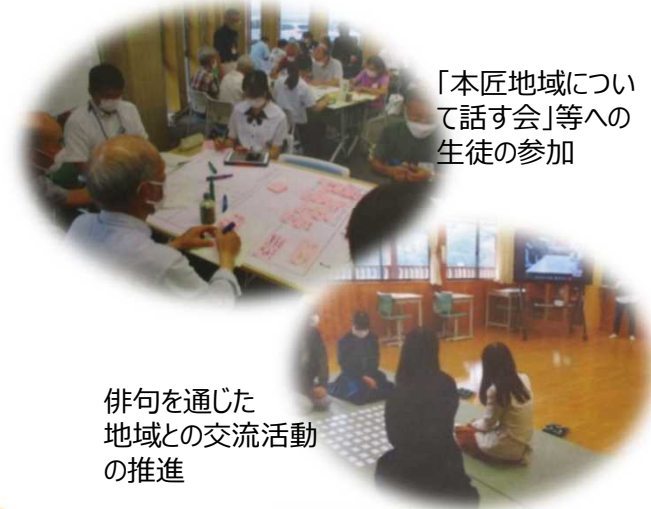
「本匠地域について話す会」等への生徒の参加