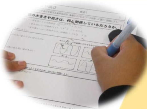
音の大小、高低の違いと振動、振幅の関係性について自分の考えをもち、実際に実験して確認する