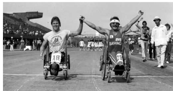
第1回大会のフィニッシュシーン 手と手を取りあい 「友情の同時優勝」を主張する選手