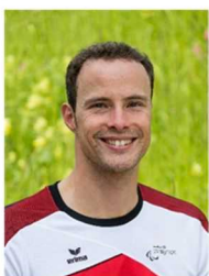
マルセル・フグ(スイス) 37歳