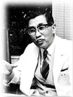
故・中村裕博士 太陽の家は、東京 2020 パラリンピック競技大会の聖火の大分県集火式の会場にもなりました。

マラソンは男子、女子ともに最速クラスの世界記録が本大会で樹立されており、男子はスイスのマルセル・フグ選手（第 40 回記念大会<2021 年> 1 時間 17 分 47 秒）、女子はスイスのマニュエラ・シャー選手（第 39 回大会<2019 年> 1 時間 35 分 42 秒）が世界記録保持者です。