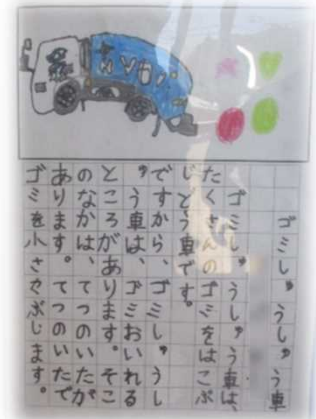
「書く」活動の充実を図る