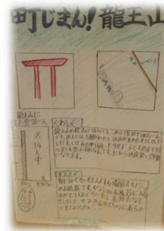
算数の力も活用しながら 龍王山の紹介を書く