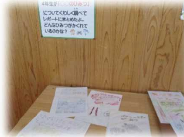
学習の成果物を展示