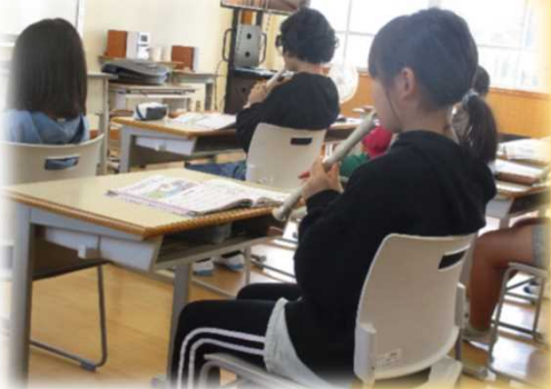
既習事項やめあて（旋律の重なりを感じる）を意識しながら歌ったり演奏したりする