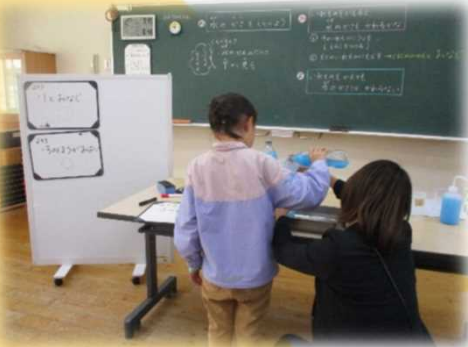
水のかさについて、直接比較しながら大きさを実感できるようにする工夫