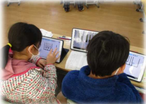
絵文字の特徴を踏まえて、自分たちの絵文字を同時編集し紹介しあう