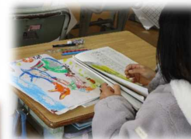
自分が読んだお話の中で 心に残ったことを絵にして 紹介しあう