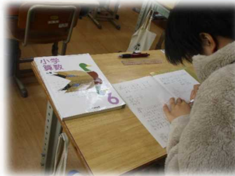
課題に対する自分の考えを書く 自分で創るノート