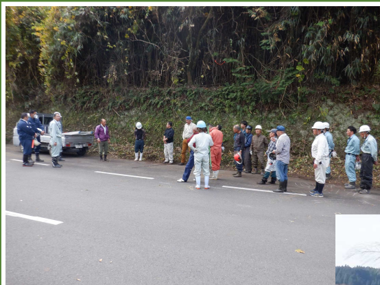
↑ 参加者打合せの様子