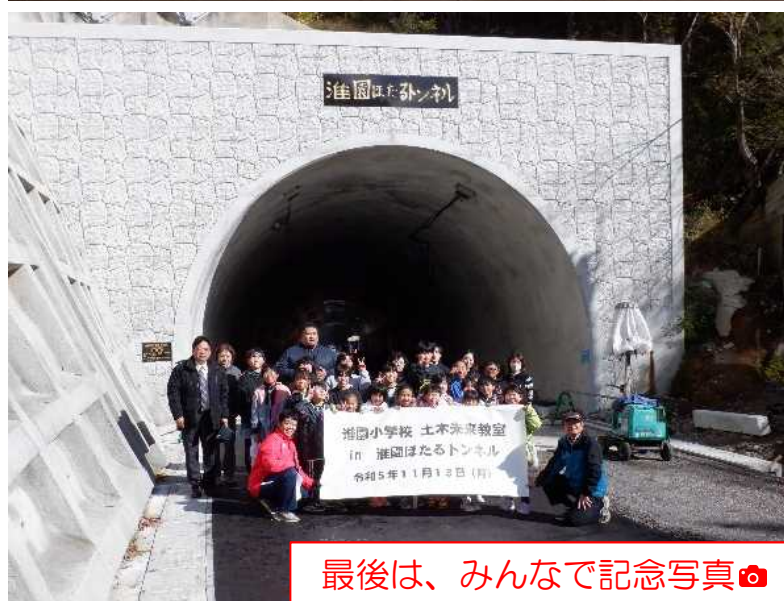
最後は、みんなで記念写真📷