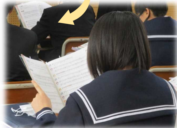
めあてを確認して、「魔王」を鑑賞する

「魔王」 作詞…ゲーテ 作曲…シューベルト めあて 登場人物の特徴や気持ちを表す歌い手や作曲者の工夫を 目的とする