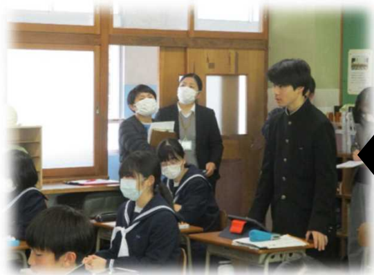
グループごとの考えを全体で共有し、課題に対するまとめをつくる