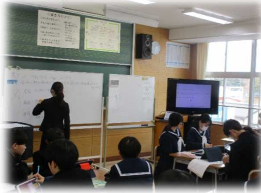
グループごとに考えを統合する