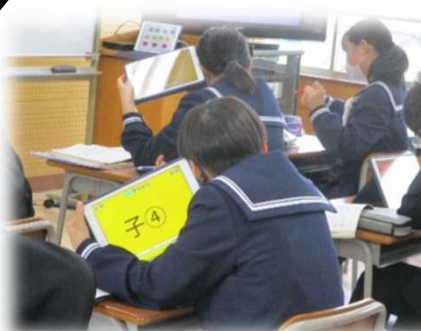
登場人物ごとに、音色・高低・強弱を 視点に「魔王」を聴く