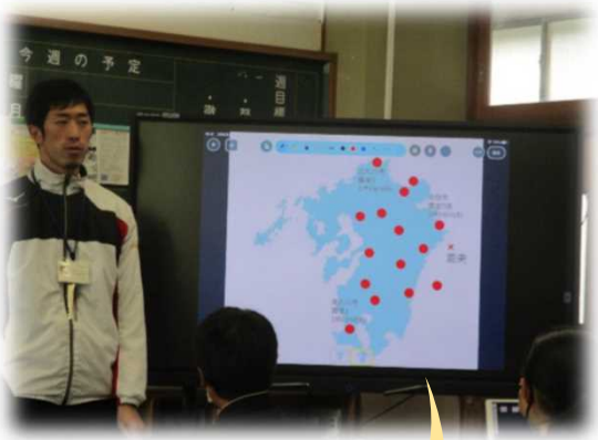
課題) 地震の揺れはどのように伝わっていくのだろうか？