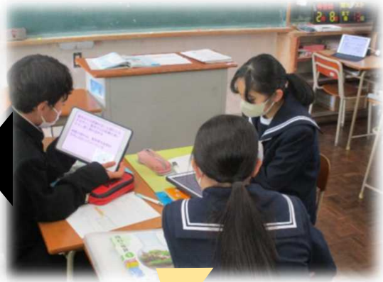
グループで自分の考えを出し合い、比較したり関連付けたりして考えをまとめる