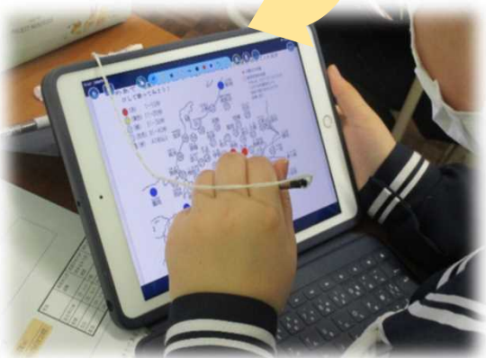
震源から揺れが到達した時間ごとに色分けして、伝わり方を可視化する