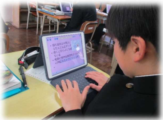
地面の揺れは東西南北の方向に円になるように広がっていくのではないかと