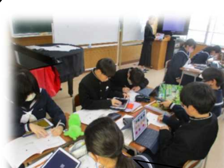
最初は落ち着いた感じだったけど、サ 最後の方は慌ただしい感じがした・・・