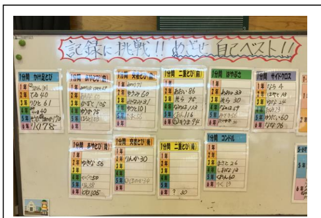
縄跳びボード ～めざせ学年記録, めざせ自己ベスト～