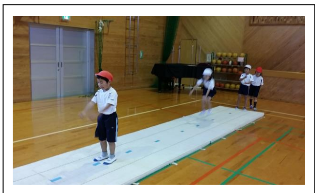
単元に応じたサーキット ～両足ジャンプ何回で行けるかな？～