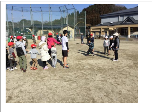
パワーアップタイム～たてわり班の長なわ跳び～