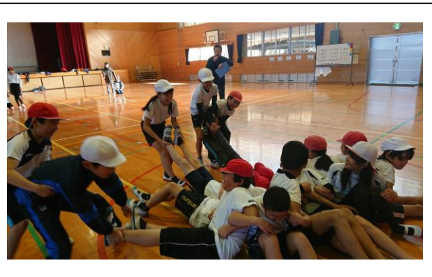
5年 体づくり運動 「大根引き」