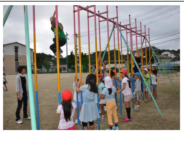
パワーアップタイム～固定遊具めぐり～