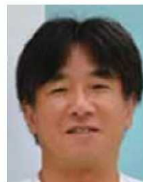
大分大学客員教授、 中津市立中津市民病院

大分県は、修学旅行・スポーツ大会など団体旅行を多数受入れています。本冊子メニューを活用・アレンジして、組合全体で「安全・安心な旅館・ホテル」をつくっていただけるといいですね。