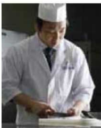
大分県旅館ホテル生活衛生同業組合 ホテル別府パストラル

本取り組みを契機として、食物アレルギーへの理解を深めて頂くとともに、安全に提供できるユニバーサルメニューの普及・継続ができるよう望んでおります。