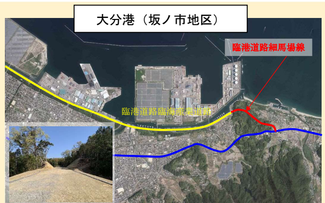
令和4年度実施 道路改良工