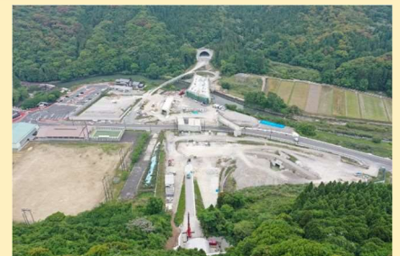
三光本耶馬溪道路 整備状況 (青の洞門・羅漢寺IC付近)