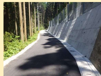
朝田日田線 (日田市)