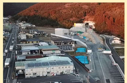
日田山国道路 整備状況