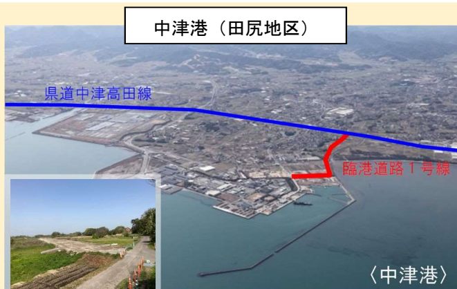
令和4年度実施 道路改良工

物流の効率化とともに渋滞緩和、安全性の向上等を図るため、臨港道路の整備を推進しています。