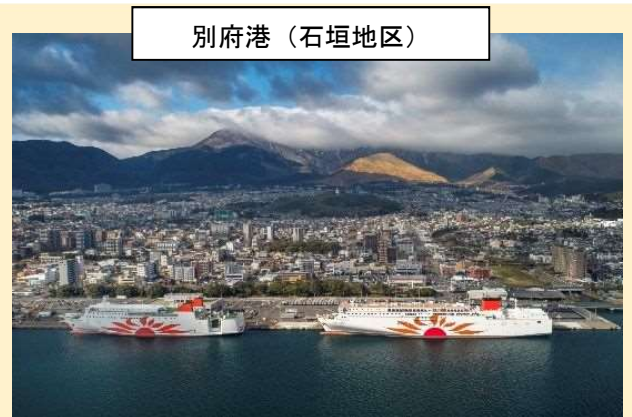
令和4年度実施 防衝板等設置