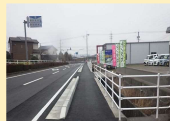
大田杵築線 (杵築市)