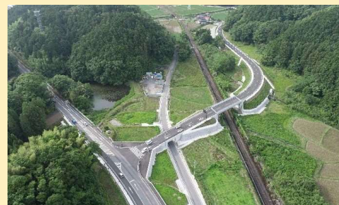
県道佐田山香線 立石工区(別府市)

・異常気象時等においても地域間のネットワークを確保するため啓開ルート上ののり面崩壊対策を推進しています。令和4年度は、国道217号など4路線4箇所を実施しました。