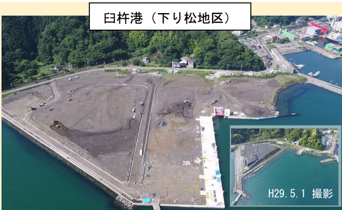
令和4年度実施 岸壁及び埠頭用地造成工