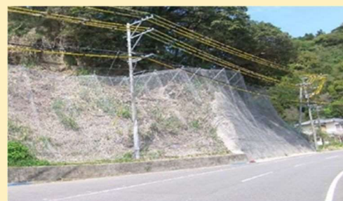
啓開ルート 国道217号 (臼杵市)