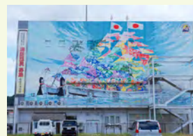
佐伯市消防署壁画（ジョーヤラ船）