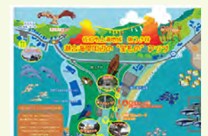
瀬会（ぜあい）海岸周辺宝ものマップ