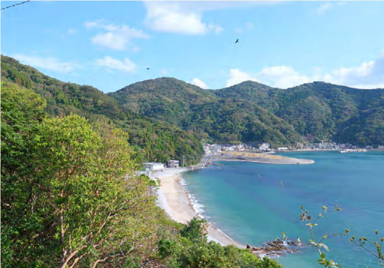
瀬会（ぜあい）海岸と魚つき保安林