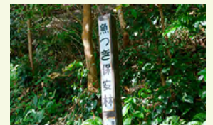
魚つき保安林の標柱