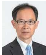
大分県知事 佐藤 樹一郎