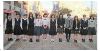
県内の女子学生に向けた人材発掘・育成

先端技術やSTEAM的思考、理工系分野等への 興味・関心の促進による女子生徒の進学支援・人材育成