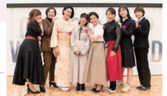
おおいたスタートアップウーマンアワード