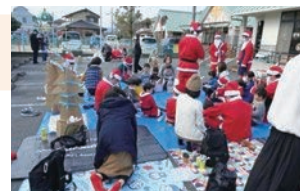
子育てパパのコミュニティづくり