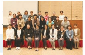
女性農業経営士興業種事例研修