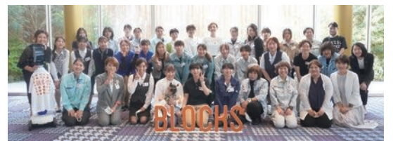
建設業界で働く女性向けのスキルアップセミナー