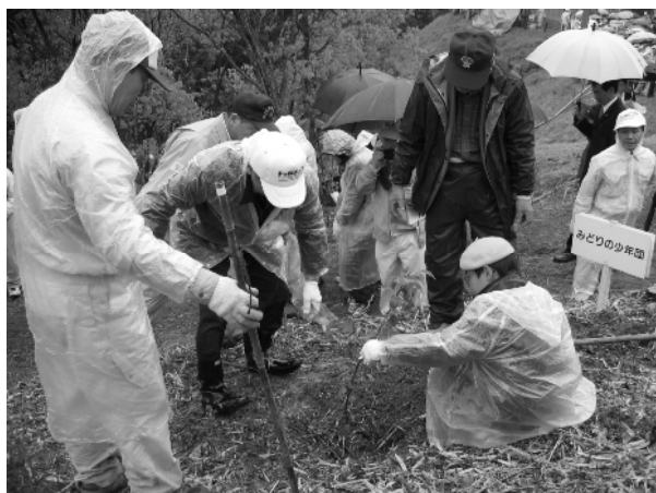
第6回豊かな国の森づくり大会