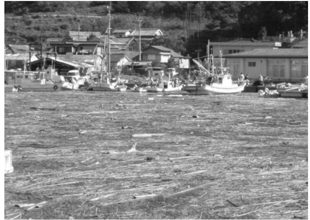
台風後の漁港の状況(平成16年台風23号)