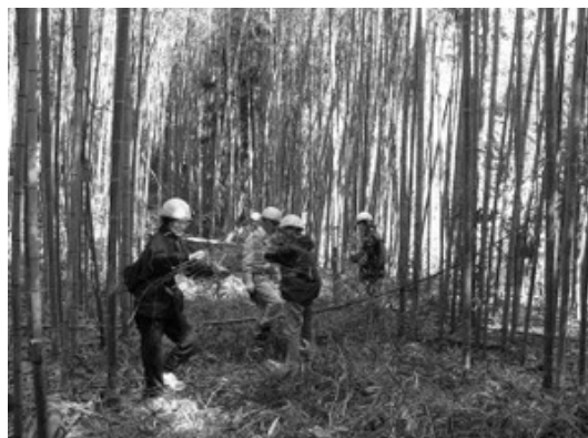
竹林の整備(森林づくり提案事業)