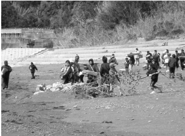
間越海岸での清掃状況

実施日： 平成19年3月18日 場 所： 佐伯市米水津間越海岸 参加者： 200名