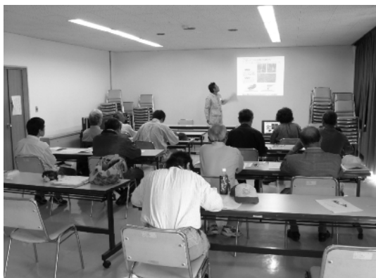
森林ボランティアへの技術講習(初級)