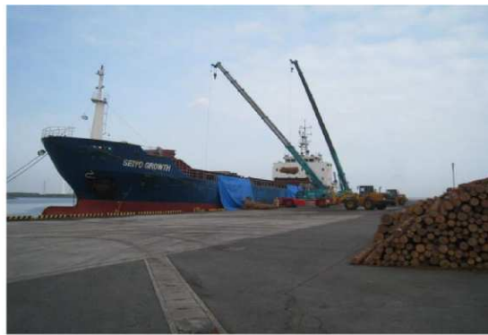
在来船への積み込み状況