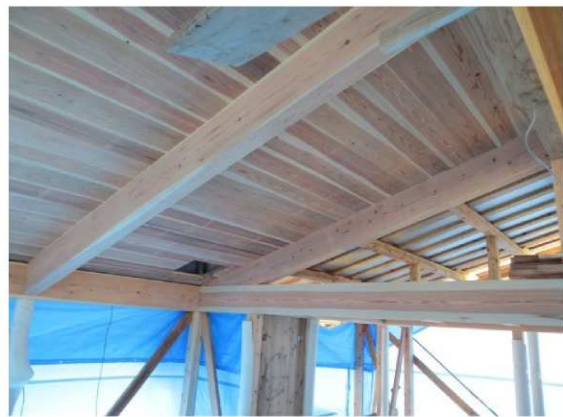
高品質スギ乾燥材【梁・桁】