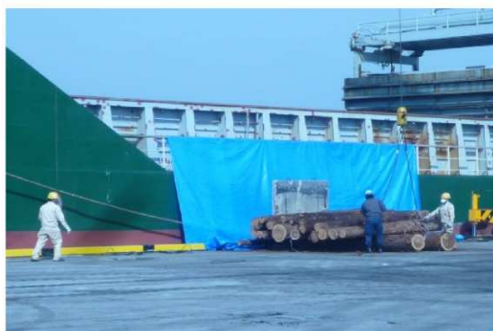
在来船への積み込み状況