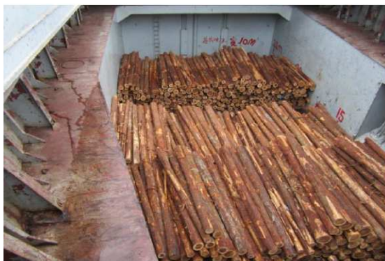
在来船への積み込み状況