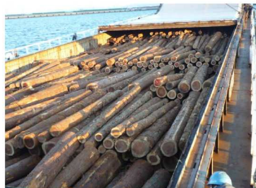
船舶への積込状況