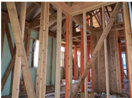
高品質スギ乾燥材【梁・桁】