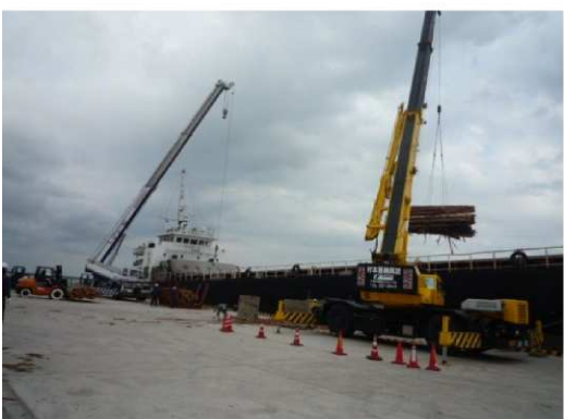
船舶への積込状況