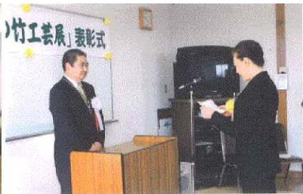
くらしの中の竹工芸展及び表彰式