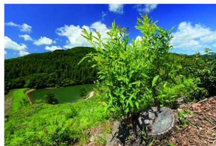
モデル林 武蔵町 育成天然林型(クヌギの循環林)