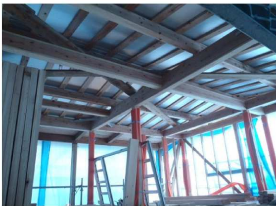
高品質スギ乾燥材【梁・桁】