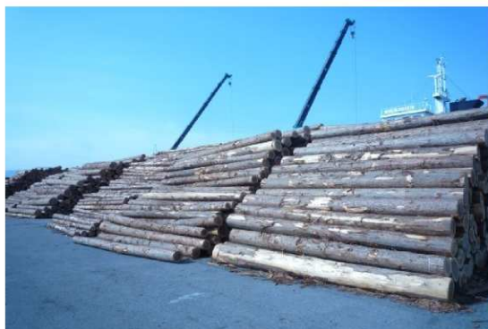
積み込み予定のスギ原木