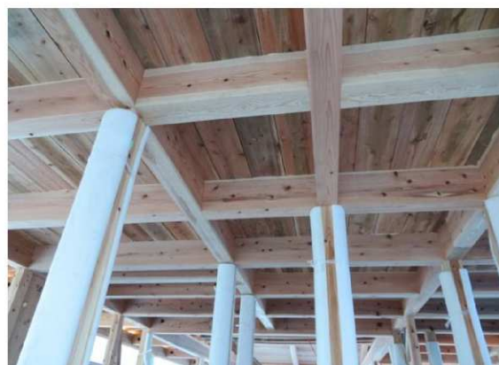
高品質スギ乾燥材【梁・桁】