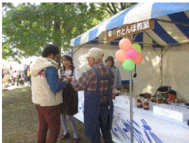
農林祭 竹とんぼ教室