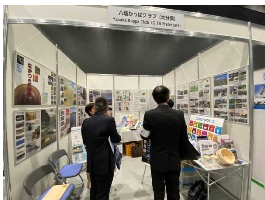
①アジア・太平洋水サミット