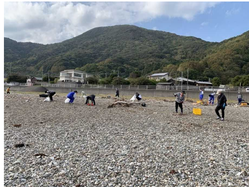
佐伯市観光協会上浦支部 瀬会海岸・福泊海岸・蒲戸海岸