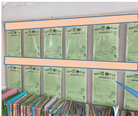
体育大会の「振り返り」