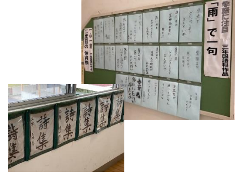
生徒作品の掲示物