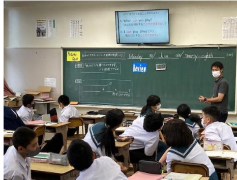
1年 英語科 ⇒ 会話のトピック