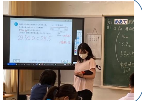
3年 数学科 ⇒ 電子黒板の使用