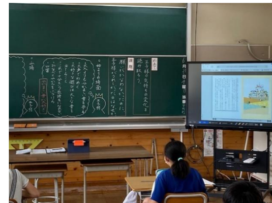
3年 算数科 ⇒ 1人1台端末の活用