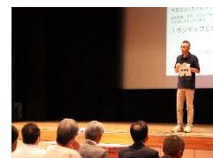
総会時の講演会の様子