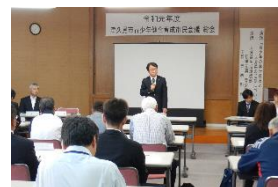
総会の様子(令和元年度)

津久見市青少年健全育成市民会議では、インターネット関連のトラブルや非行、犯罪被害などの様々な問題から子どもたちを守るため、地域ぐるみで青少年を見守り育む環境づくりを推進しています。年度初めの総会で、青少年の健全育成に関わる有識者を招聘して研修会を行い、大人の青少年に関わる意識強化を図っています。その他例年の主な取組としては、毎月第3金曜日に市内各学校やPTA、市民会議委員などの協力の元、街頭あいさつ運動を実施しています。また、11月には青少年健全育成や子ども支援に関わる有識者を講師に迎え、市の福祉部局と共同で「子どもの安全を考える市民講演会」を開催しています。今年度は残念ながら新型コロナウイルス感染症の影響により一部の活動を中止するなどの変更が出ていますが、県下の感染拡大状況を踏まえつつ、子どもたちが健やかに育つ地域づくりを目指し、引き続き取組を行っています。