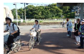
街頭あいさつ運動の様子(令和2年度)