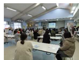
豊田校区子育て講座

今後もこのような活動を通して、中津の子ども達が健やかに育つ環境づくりに努めたいと考えています。