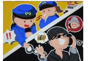
ポスター優秀作品