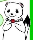
更生女性会員のオコジョさん 更生保護キャラクター