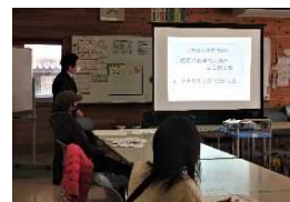
上津校区子育て講座