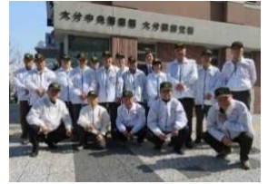
パトロール隊街頭活動

今後も、犯罪の防止及び青少年の健全な育成等の事業に取り組み、明るく安全で安心して暮らせる大分県を目指して参ります。