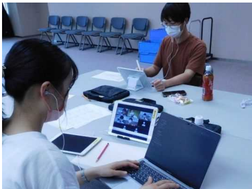
ファシリテータの様子