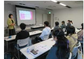
話し方講座の様子