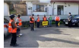
安全防犯パトロール打合せ