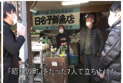
「昭和の町」をたった7人で立ち上げた