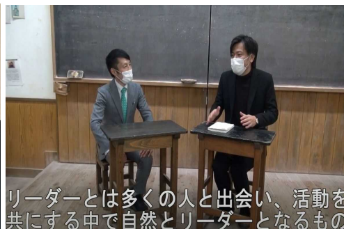
リーダーとは多くの人と出会い、活動を共にする中で自然とリーダーとなるもの