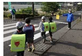
登下校時の見守り