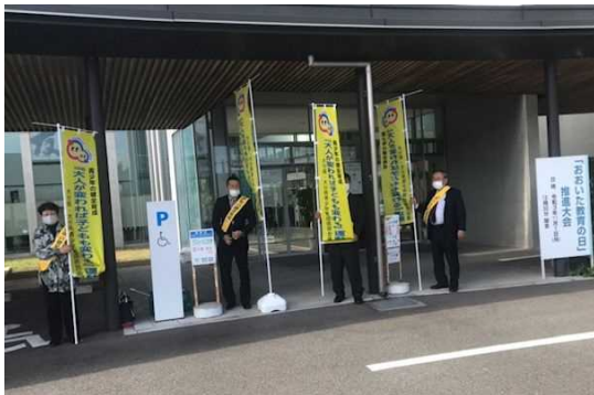
「おおいた教育の日」推進大会 あいさつ運動 ( 県民会議事務局 ・ チャイルドラインおおいた )

あいさつは人と人をつなげる大事な出会いの言葉です。子どもたちの社会性を育み、子どもたちは地域で守り育てると意識の高揚を図るため、毎月第3金曜日の「青少年の日」を中心に県下であいさつ運動を行っています。