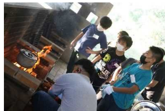
「少船ミッションⅡ」(県産食材を使った野外炊事)

地域や世代を越えて課題に向かって活動を共にした子ども達が、この研修の経験を経て、今後様々な場所で活躍できることを期待しています。