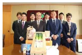
知事との意見交換

Facebookを活用した情報発信も行っており、会員の農場紹介及びインタビュー、そして農産物の食べ方提案まで行う動画配信等も掲載しています。是非、Facebookページをご覧ください、興味を持った方は「いいね」をお願いします。