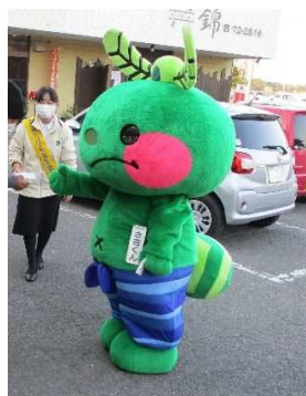
啓発ティッシュ配布 ( 国東市 あいさつ運動 )