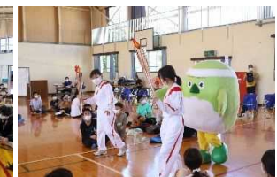
ファイナルパーティ