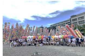
セタブロードウェイ2021

今年はコロナ禍の中ですが、時期や形を工夫しながら大分を元気にする事業を開催することができました。