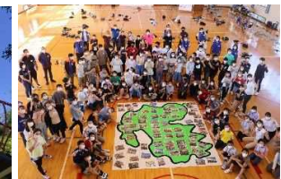
ミッションクリアの班写真を集めた県地図