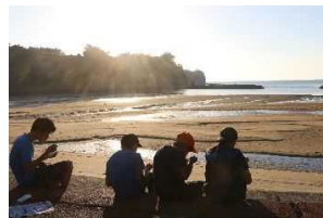
夕日を見ながら会食