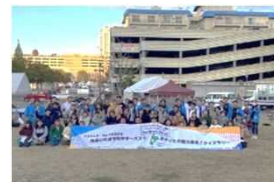
コロナ禍からの復活事業「Re:Start Oita!」