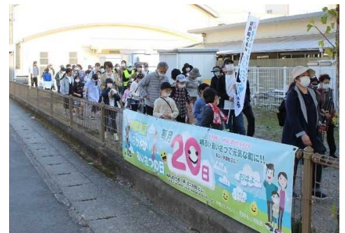
第18回境川地区「三世代ふれあいウォーク」 ( 別府市 あいさつ運動 )