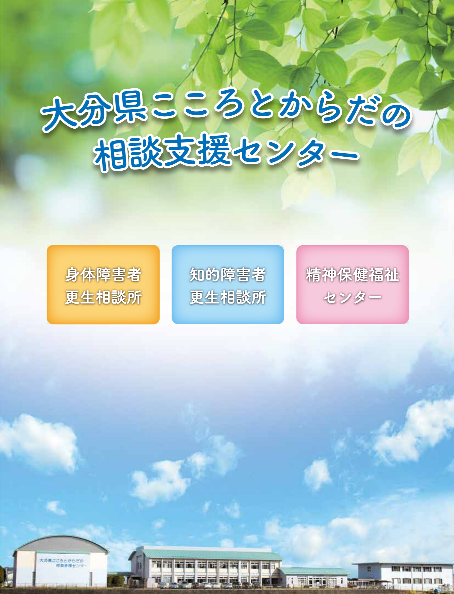
※ホワイトロードから見える田んぼの中にある青い丸屋根の建物です。